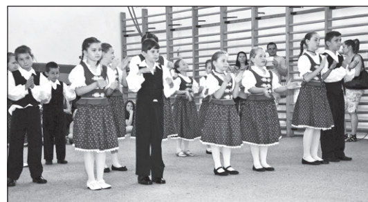
A néptánc: kultúra, mozgás, szórakozás

Mint minden évben, idén is az esztendő összes hónapjára jut legalább egy olyan program, mely segíti a lakosokat abban, hogy otthonukból kimozdulva, egymással találkozzanak, beszélgetve, kapcsolataikat szorosabbra fűzve, valódi közösségekben élhessék mindennapjaikat.