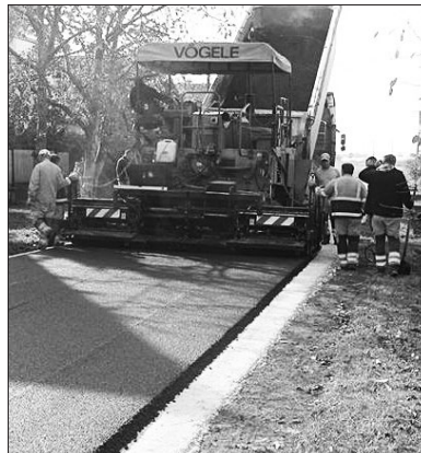
Az utak javítása lapzártánk idején is folyik

Az iskola tornatermében is történtek felújítások. Például a helyiség par-