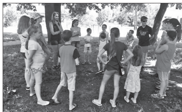
Sok-sok játék és egy kis tanulás