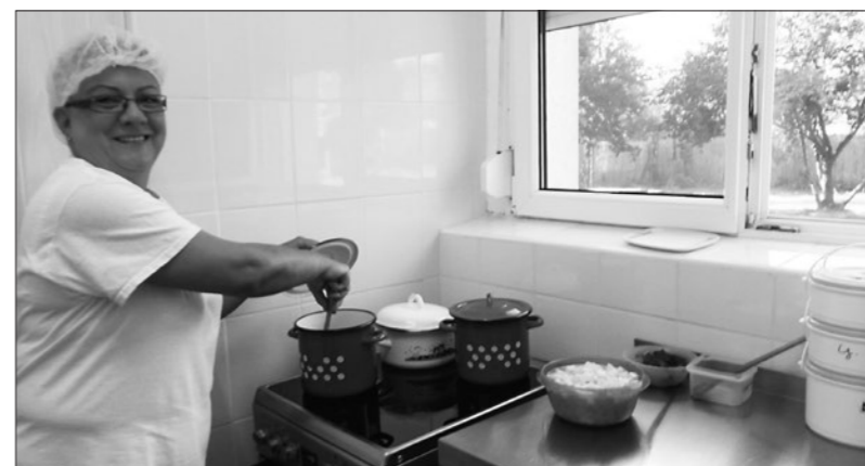
Készülnek a finom, diétás ételek