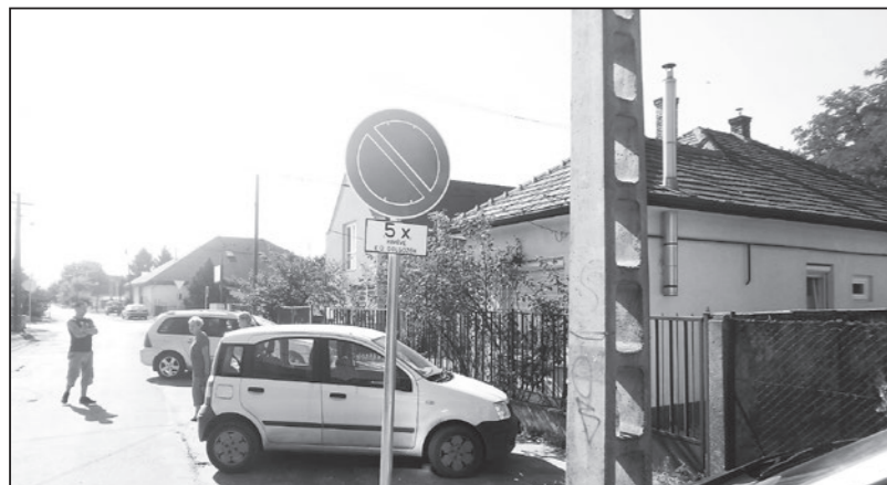
Figyeljük a korlátozó táblákat