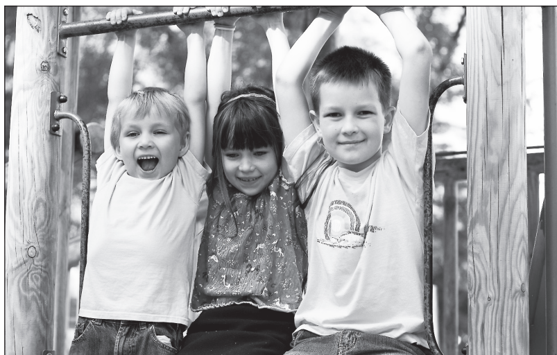
Játszótér is lesz a jelenleg üresen álló telken

Településünkre – jellegénél, elhelyezkedésénél fogva – sok család költözik. A jó közlekedési lehetőség, a főváros közelsége, a helység nyugodt életritmus sokak számára vonzó szempont lakóhely választásakor. Ezért is fontos, hogy minél több közösségi teret, sportolási és szabadidős lehetőségeket kínáljon az itt élők számára.