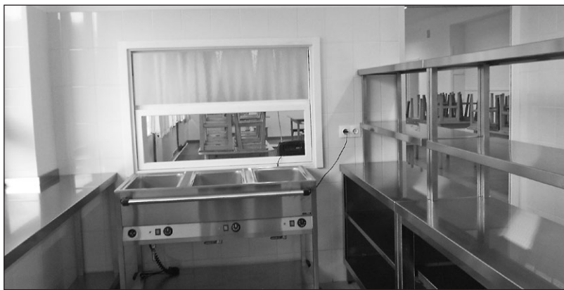
Monorierdő megújult konyhája