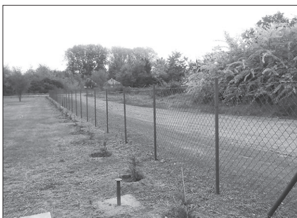
A temető mögötti erdő telepítését és a sövényültetést az SZKB elnöke koordinálja