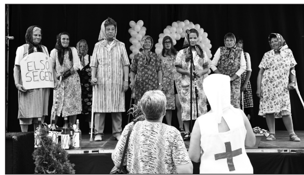
Őszirozsa Nyugdíjas Klub tánckara

napját ünnepli meg minden évben, de a születésnapjukon a polgármester személyesen köszönti a 90, 95 és 100 éveket. Egy új kezdeményezésnek köszönhetően a tavalyi évtől megünneplik a Monorierdőn élő 40 és 50 éves házasságokat is. Ezúton kérjük, hogy azok a házaspárok, akik idén ünneplik ezeket az évfordulókat, a következő telefonszámok valamelyikén jelezzék, mert idősek napján az önkormányzat szeretné felköszönteni őket: Borbás Elviránál a 06-30/625-4842 vagy Dzsupin Imrénénel a 06-30/625-9984-es elérhetőségen.