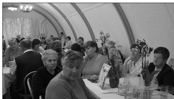
Szépkorú Nyugdíjas Klub