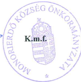
Sente Béla polgármester