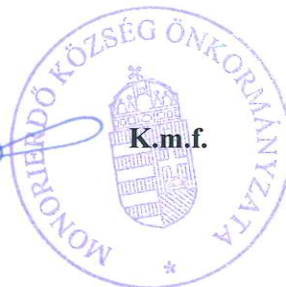
Sente Béla polgármester