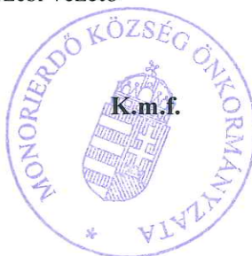
Sente Béla polgármester

Koordinálásért felelős: belső ellenőrzési vezető