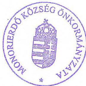
Sente Béla polgármester