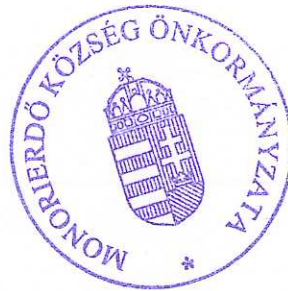
Sente Béla polgármester