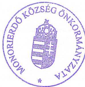
Sente Béla polgármester