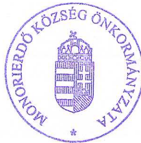
Sente Béla polgármester