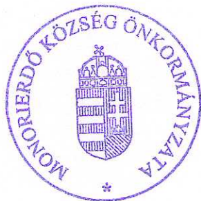
Sente Béla polgármester