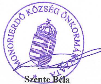
Sente Béla polgármester