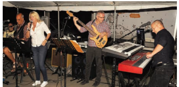
A Happy Five megint nagy sikert aratott

” A SZERVEZŐK MINDEN KOROSZTÁLY SZÁMÁRA SZERETTEK VOLNA EMLÉKEZETES PILLANATOKAT NYÚJTANI.