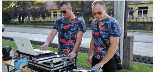
Népszerű volt a Retro buli

A sorozatot szeptember 17-én a Happy Five zenekar zárta, szolgáltatva a talpalávalót, amely – mondhatni – immár állandó résztvevője a monorierdői rendezvényeknek.