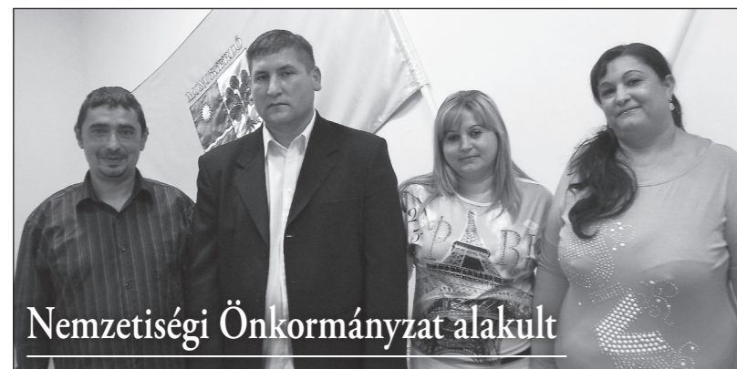
Nemzetiségi Önkormányzat alakult

A képviselő-testület minden tagja, beleértve a polgármestert is, lemondott tiszteletdíjának tíz százalékáról mandátumuk teljes időszakában, vagyis az elkövetkezendő öt évben.